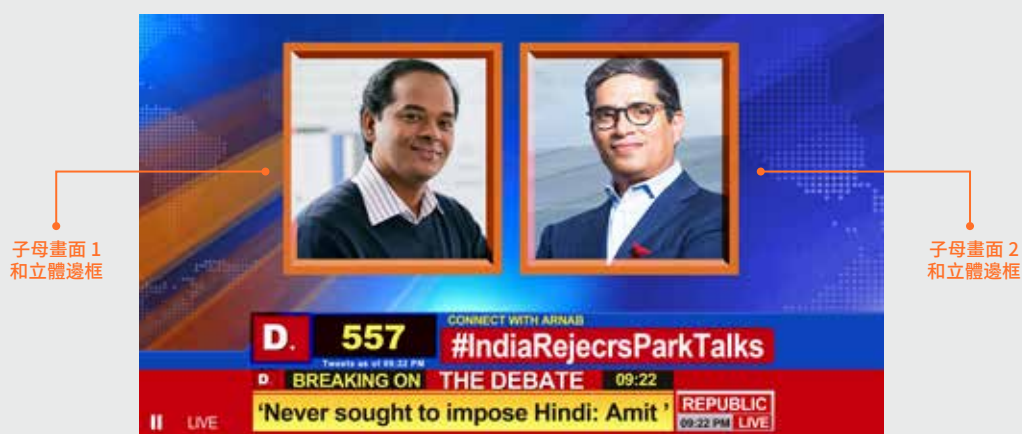
子母畫面 1 和立體邊框

可同時製作出 2 組子母畫面視窗，子母畫面的邊框大小、位置、顏色可調整，呈現出多種的畫框風格，包括獨特的 3D 立體邊框效果。