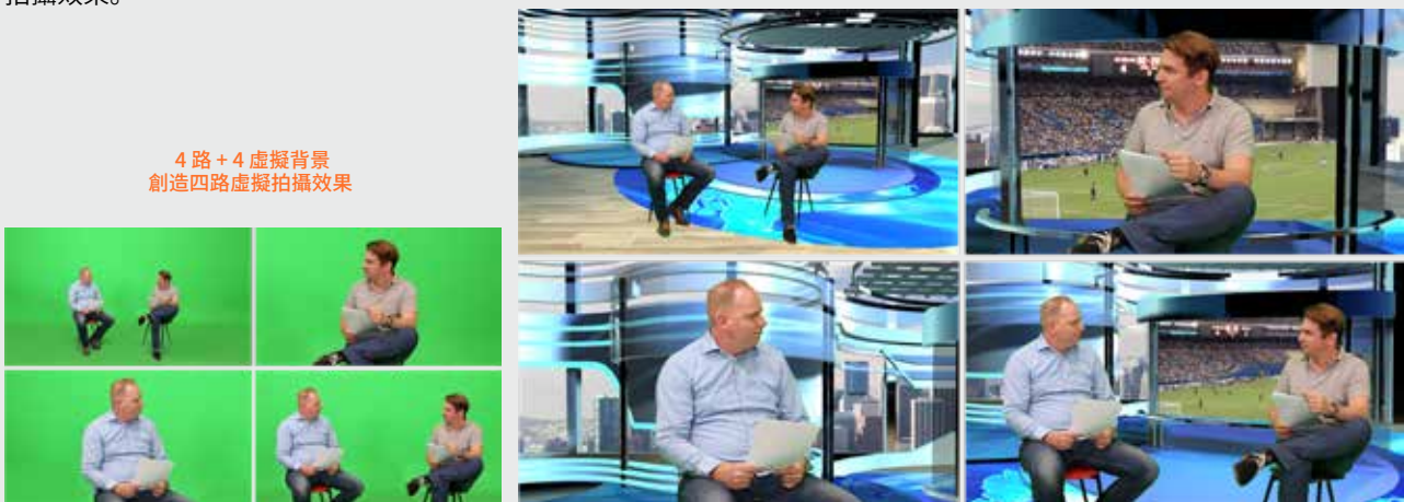
4 路 + 4 虛擬背景 創造四路虛擬拍攝效果

四組去背可設定全景、中景或單人模式的真實虛擬場景，導播就內容導播切換，導出真實模擬的虛擬拍攝效果。