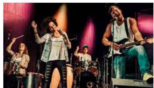
按鍵 5 (全畫面)