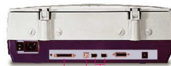
SCSI-II USB FireWire

ScanMaker 9800XL 內建三種連接介面，提供使用者更加彈性的應用。使用 FireWire 介面掃描一張 48 位元 1600 dpi 的 A3 彩色影像時，以低於六分鐘極快的時間即可完成掃描，而且它具有隨插即用的熱插拔功能，連接使用非常方便容易。除了 FireWire 介面外，掃描器本身還配備有符合工業標準的 USB 和 SCSI-II 介面，提供使用者不同電腦設備的連接選擇。