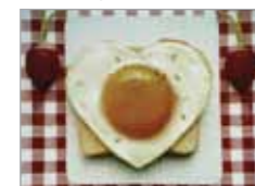
* 投影畫面為示意圖